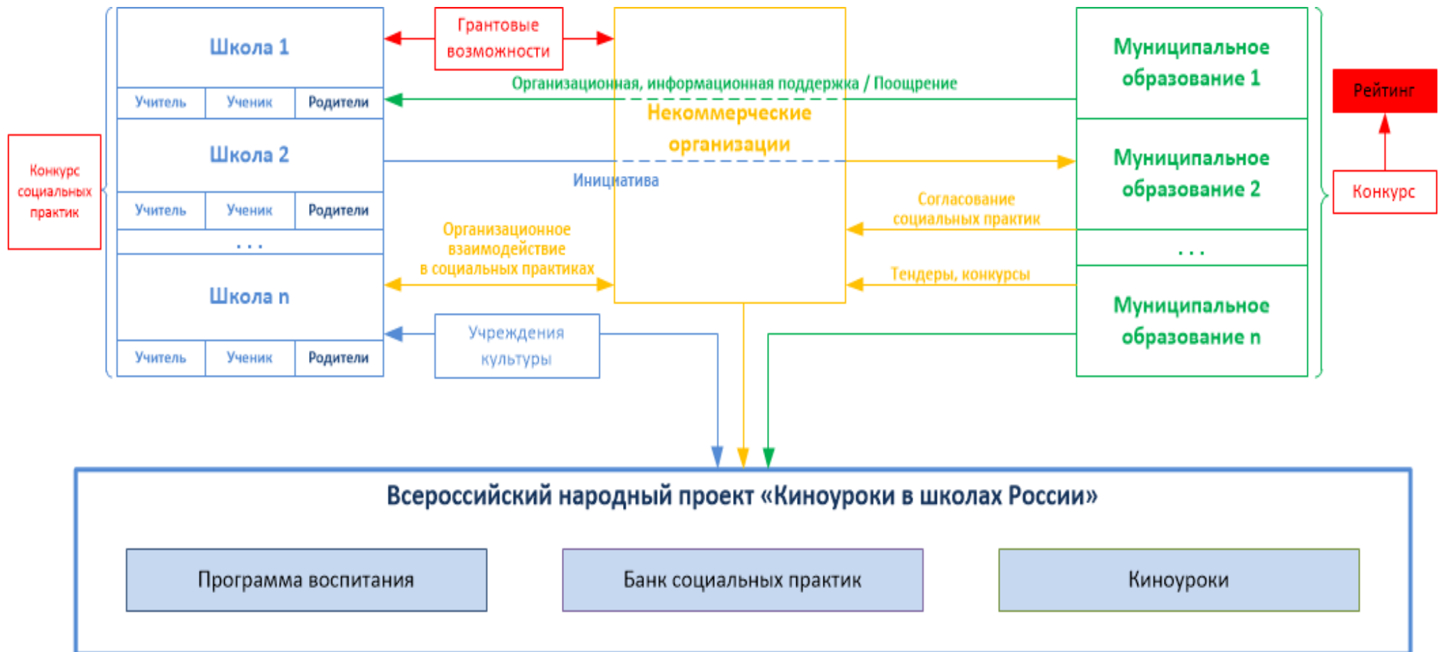
Модель организации социальных практик